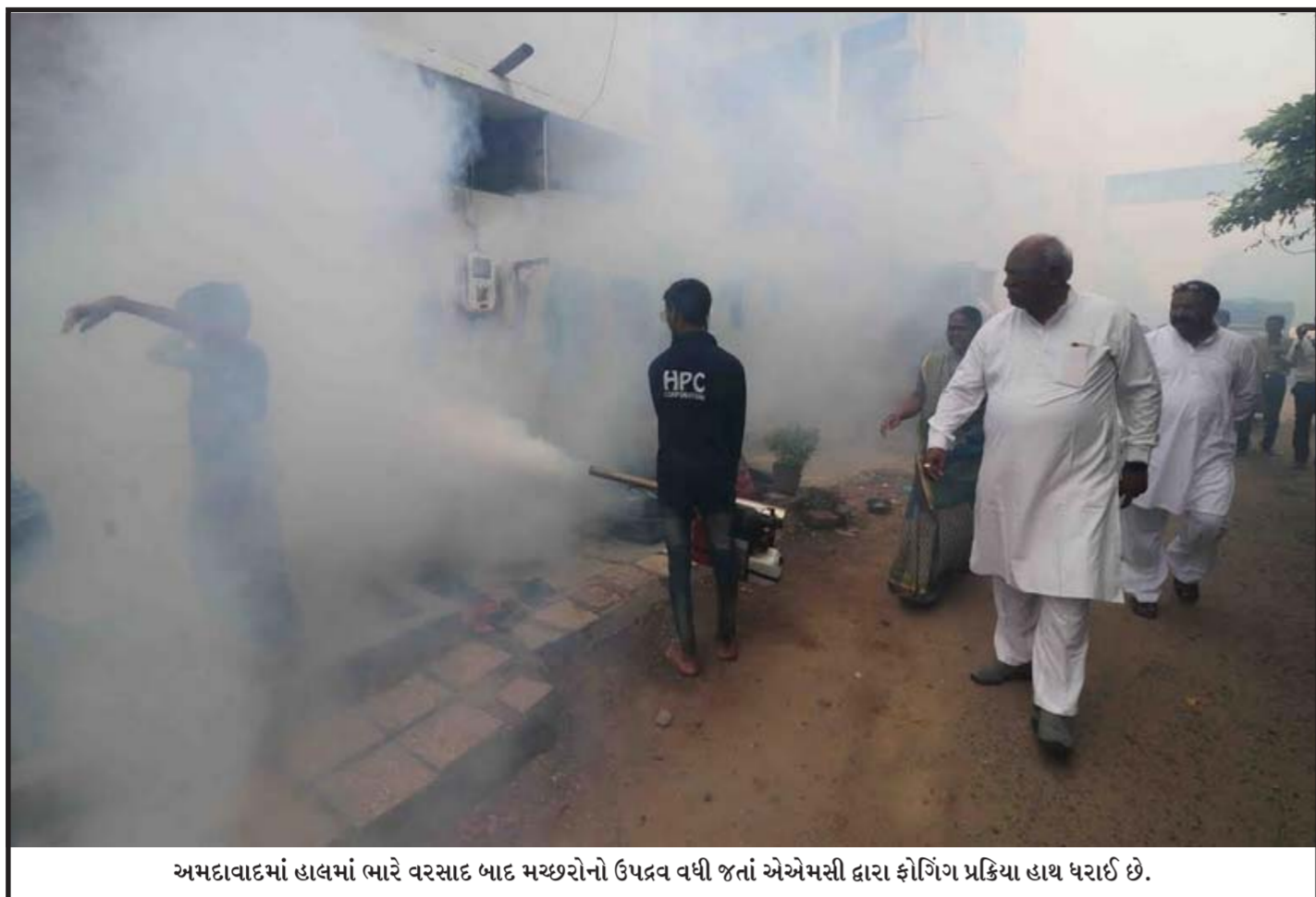
અમદાવાદમાં હાલમાં ભારે વરસાદ બાદ મચ્છરોનો ઉપદ્રવ વધી જતાં એએમસી દ્વારા ફોર્ગિંગ પ્રક્રિયા હાથ ધરાઈ છે.